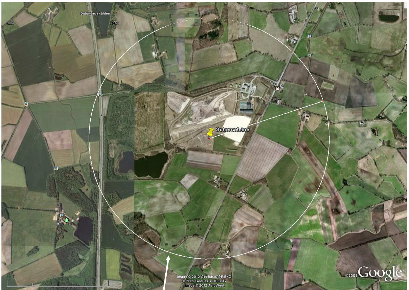
Abbildung 2: Umgebung der geplanten Biogasanlage