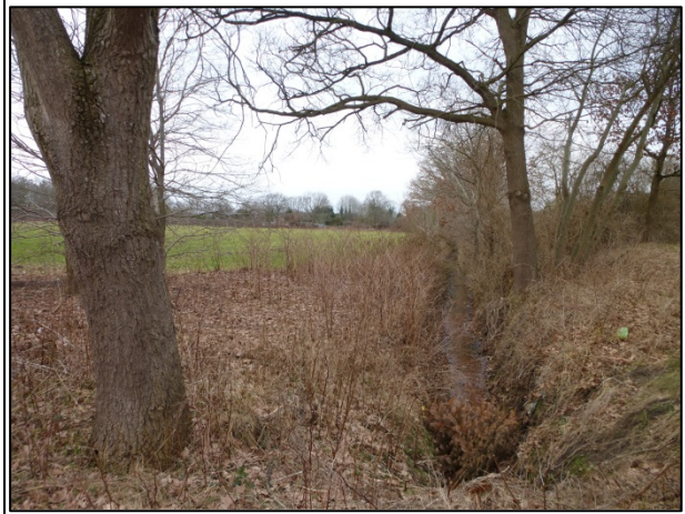
Bild 4: Stark verschmutzter, von Gehölzen beschatteter Graben an der Grenze zur östlichen Wohnbebauung, Blick nach Norden