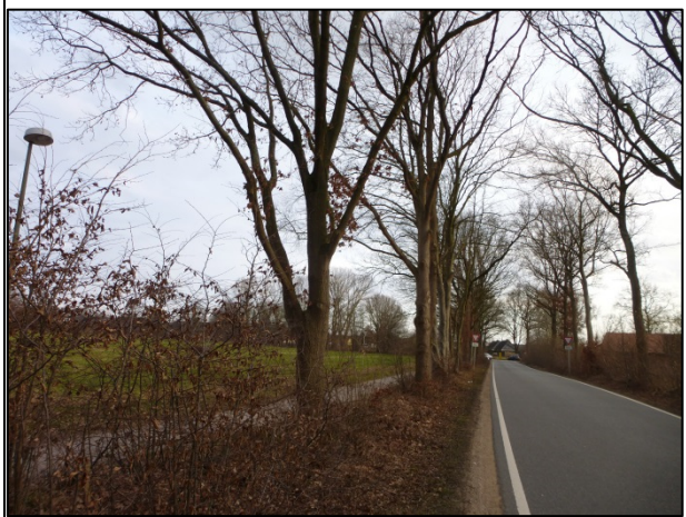
Bild 2: Schwarzer Weg mit hohen Laubbäumen eines durchgewachsenen Knicks und Rad- und Fußweg, Blick nach Süden