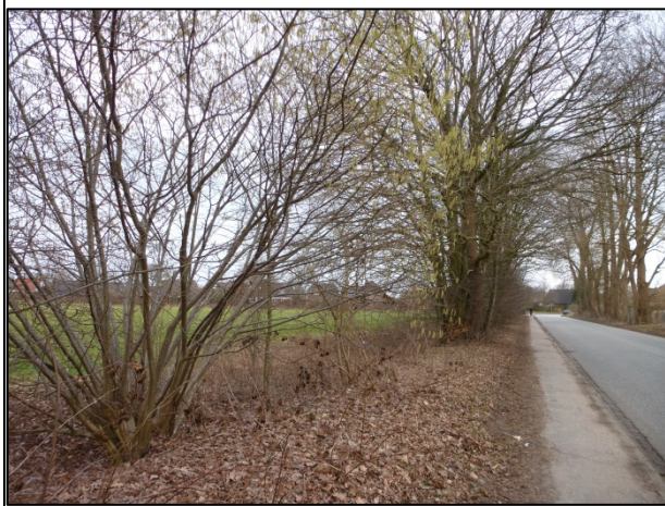
Bild 1: Durchgewachsener Knick auf einem niedrigen Wall entlang der Niebüller Straße, Blick nach Osten