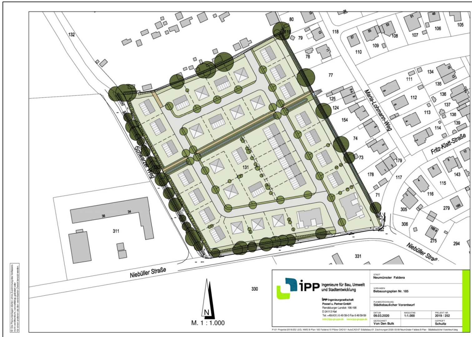
Abbildung 2: Städtebaulicher Vorentwurf