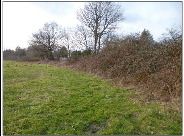
Bild 8: Breiter dichter Brombeersaum an der Nordgrenze des PG entlang des Kleingartengeländes. Der Baum im Vordergrund wird überplant. Blick nach Westen