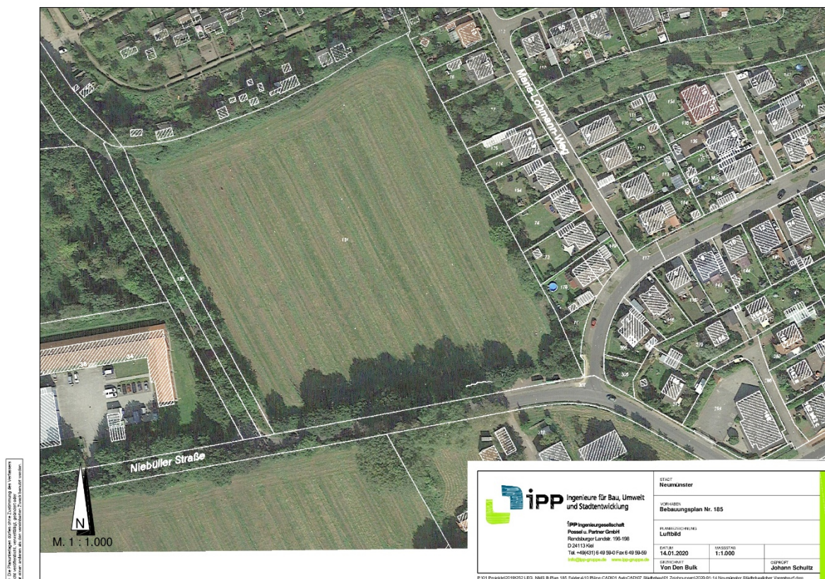
Abbildung 1: Luftbild mit Lage des Grundstücks an der Niebüller Straße in Neumünster (Quelle: IPP, Stand 14.01.2020)

Nach Sichtung der zur Verfügung gestellten Planunterlagen (s. Abb. 2 und Abb. 3) ist von dem überwiegenden Erhalt der randlichen Gehölzstrukturen auszugehen. Es ist eine Zufahrt im Südwesten von der Niebüller Straße aus vorgesehen. Dort wird ein Knickabschnitt mit mehreren jüngeren Eichen und eine ältere Eiche überplant. Am nördlichen Ende der Erschließungsstraße werden am Rande des dortigen Gartengeländes zwei weitere Laubbäume überplant. Insgesamt wird auf einer Fläche von 19.877 m 2 Wohnbebauung vorgesehen. Weitere 1.987 m 2 sind für Grünflächen und 3.930 m 2 für Verkehrsflächen bestimmt. Es sollen neue Baumpflanzungen entlang der neuen Straßen erfolgen. Außerdem soll eine quer durch das Gebiet verlaufende Grünstruktur mit Fußweg das Gebiet gliedern. Sie wird als Verlängerung einer bereits vorhandenen Grünstruktur vom östlichen Wohngebiet (an der Maria-Lohmann-Straße) zum Schwarzen Weg führen. Entlang des Rad- und Fußweges am Schwarzen Weg wird eine Heckenpflanzung vorgesehen. Im Nordwesten wird ein Fußweg aus dem Wohngebiet nach Norden herausführen.