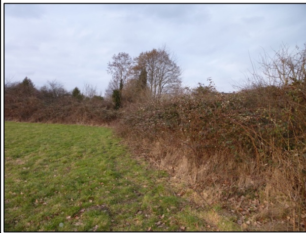
Bild 7: Winkel aus dichtem Brombeergestrüpp im Nordosten entlang der PG-Grenzen, Blick nach Norden