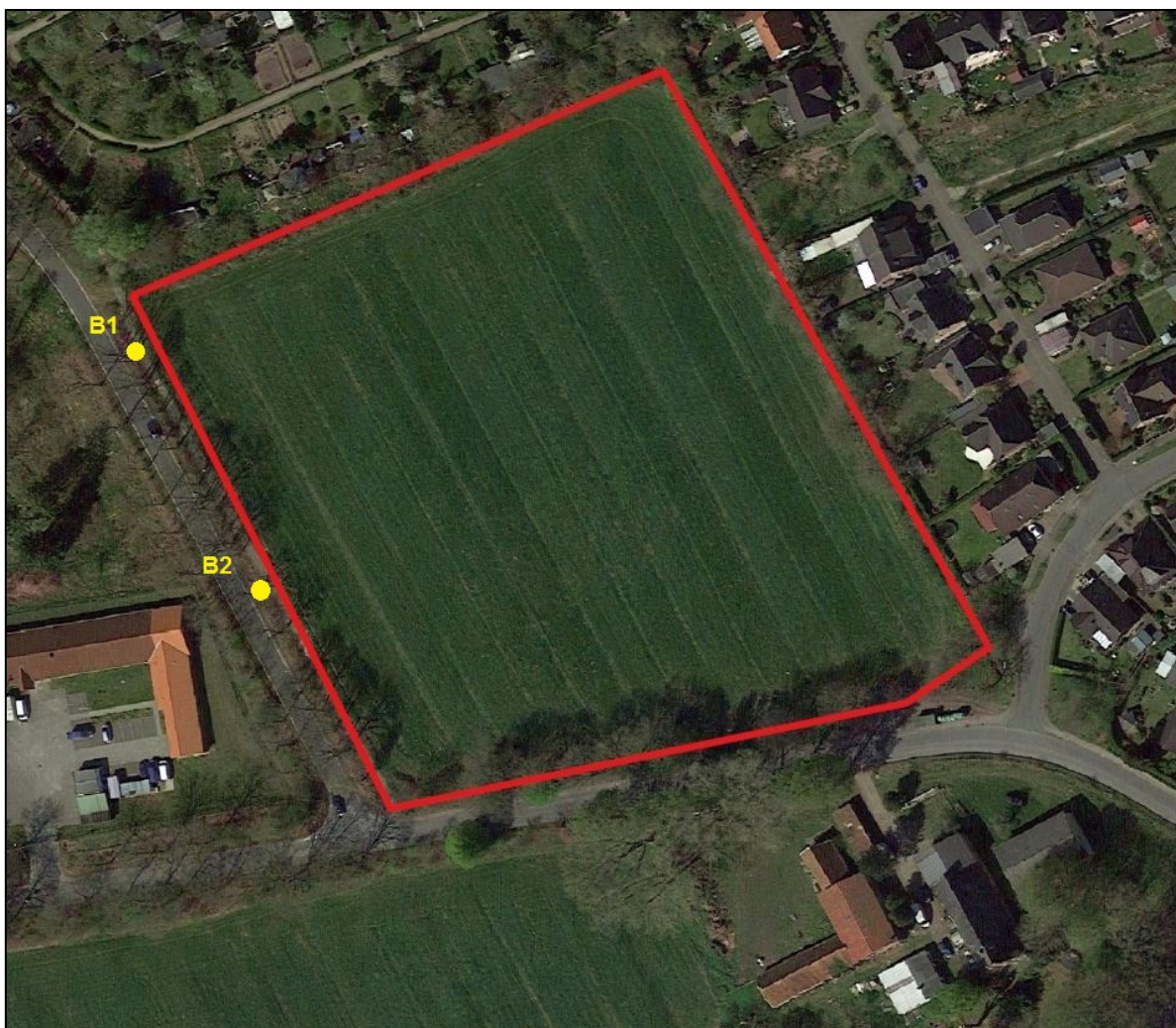
Abbildung 4: Lage der ermittelten Höhlenbäume mit potenzieller Wochenstubeneignung, auf der Grundlage der Kartierung am 25.02.2021