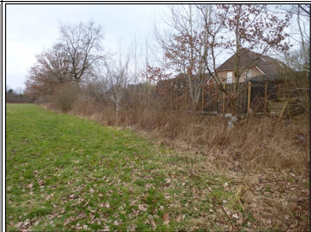
Bild 6: Blick entlang der Ostgrenze des PG nach Norden, Brombeergestrüpp entlang des Grabens, rechts davon die Wohngrundstücke an der Maria-Lohmann-Straße