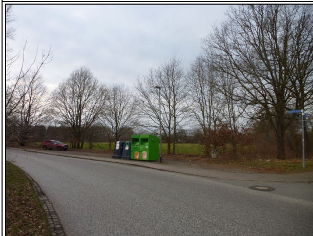
Bild 5: Lückiger Gehölzbestand des Knicks an der Niebüller Straße mit mehreren jüngeren Eichen, rechts im Bild eine ältere Eiche. Dort ist die Zufahrt geplant., davor ein Wertstoff-Sammelplatz