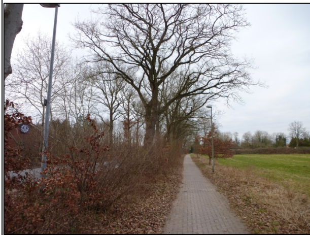
Bild 3: Der Rad- und Fußweg ist zum Grünland hin mit einzelnen jüngeren Gehölzen begrenzt, Blick nach Norden