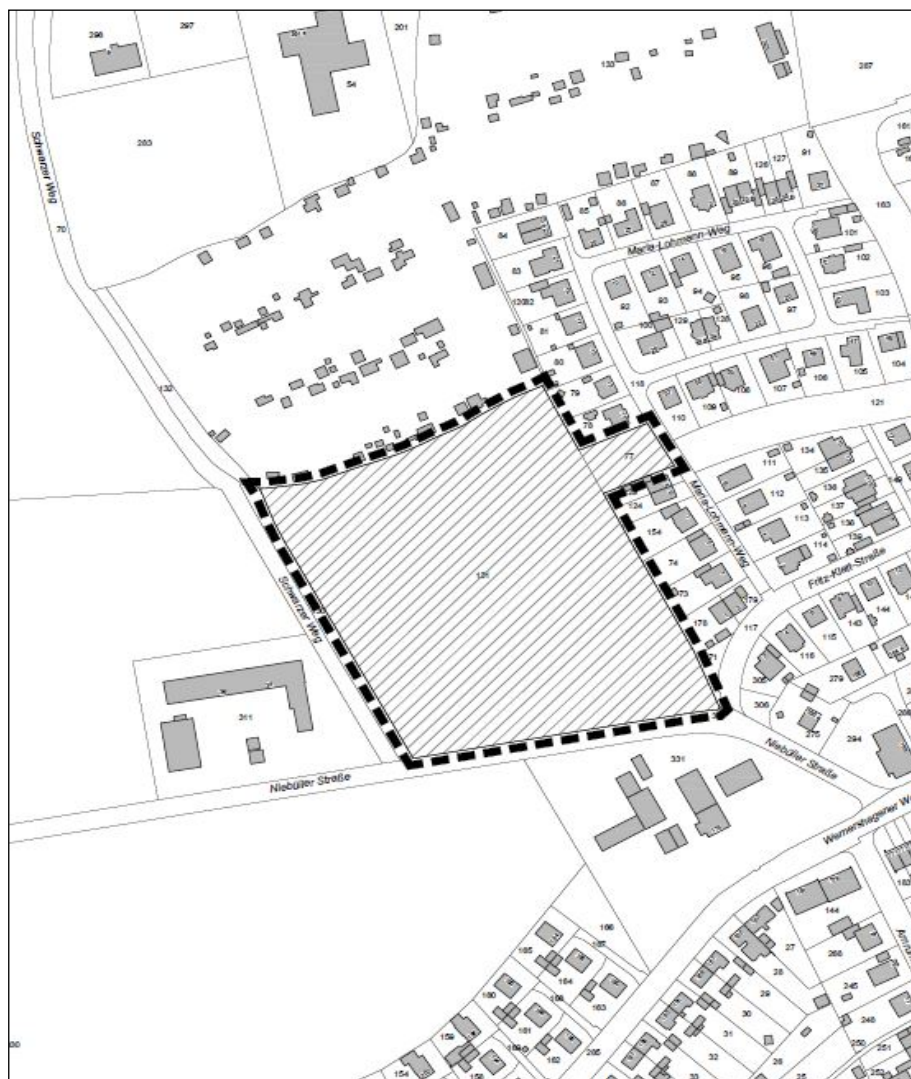
Übersichtsplan o. M

FÜR DAS GEBIET ZWISCHEN DEM SCHWARZEN WEG, DER NIEBÜLLER STRAÙE, DER KLEINGARTENANLAGE „GLÜCK AUF“ UND DEM MARIA-LOHMANN-WEG IM STADTTTEIL FALDERA