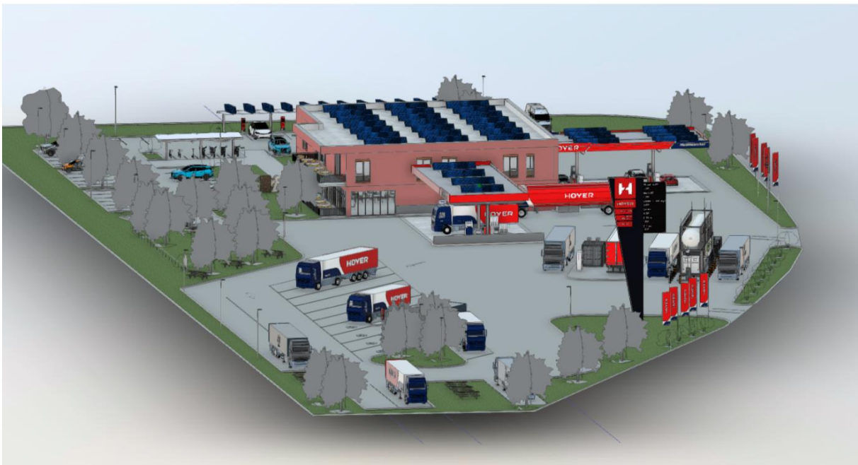
Entwurf 04 stand 17.02.2023.png