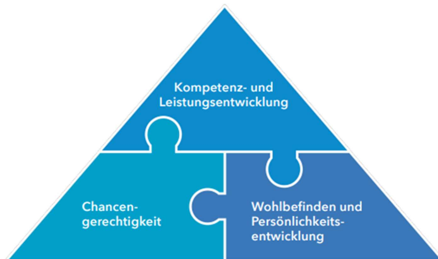
Abbildung 2: Ministerium für Allgemeine und Berufliche Bildung, Wissenschaft, Forschung und Kultur (2025): Gute Ganztagsbildung und -betreuung in gemeinsamer Verantwortung. Pädagogisches Rahmenkonzept 2026. S. 9.