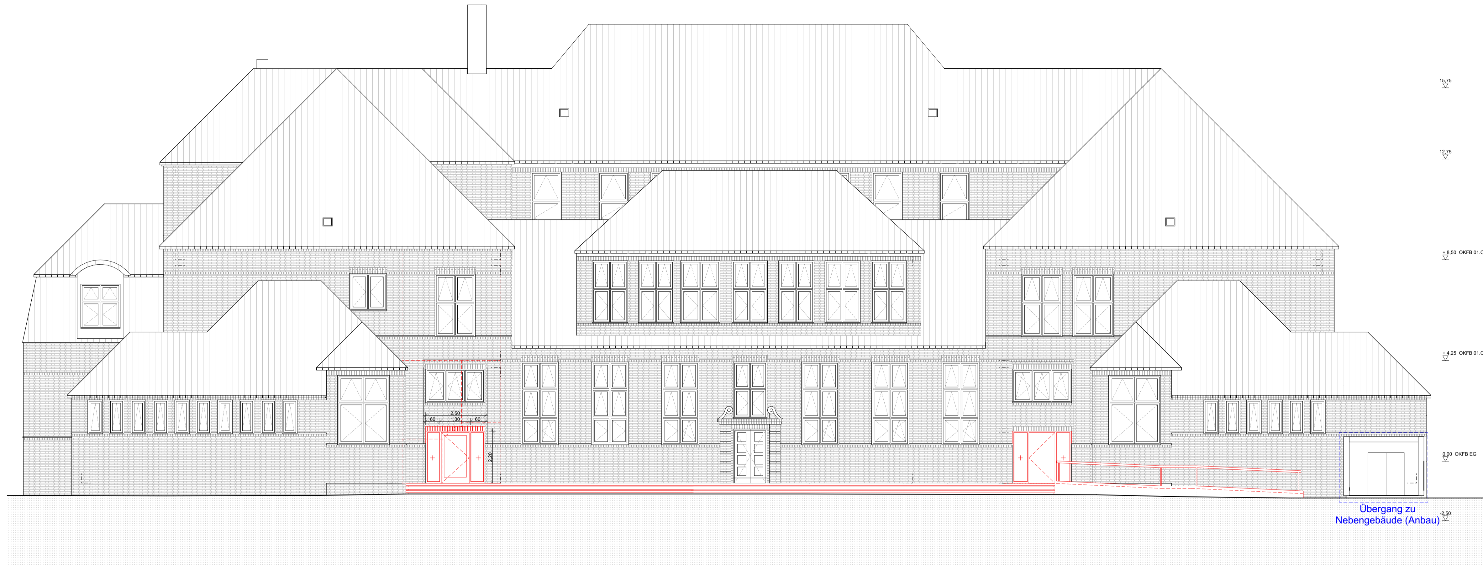
01 Ansicht Nord - West - Schulhof M 1:100

Der Entwurf ist geistiges Eigentum des Planers und urheberrechtlich geschützt. Vervielfältigungen und Weitergabe an Dritte erfolgt nur mit ausdrücklicher Genehmigung des Planverfassers. Alle Maße, Massen und Gegebenheiten am Bau und Umgebungsbestimmungen sind vom Unternehmer eigenverantwortlich zu prüfen. Bei Unstimmigkeiten ist unverzüglich die Bauüberwachung zu informieren. Dieser Plan ist nur gültig in Verbindung mit den aktuellen statischen Konstruktionsplänen und sämtlichen Detailplänen. Schlütze und Durchbrüche sind aus den Haustechnik- und Statikplänen zu entnehmen. Brüstungs-, Tür- und Fensterhöhen beziehen sich auf den Fertigfußboden. Alle Höhenangaben beziehen sich auf OK FB im jeweiligen Gebäudeteil.