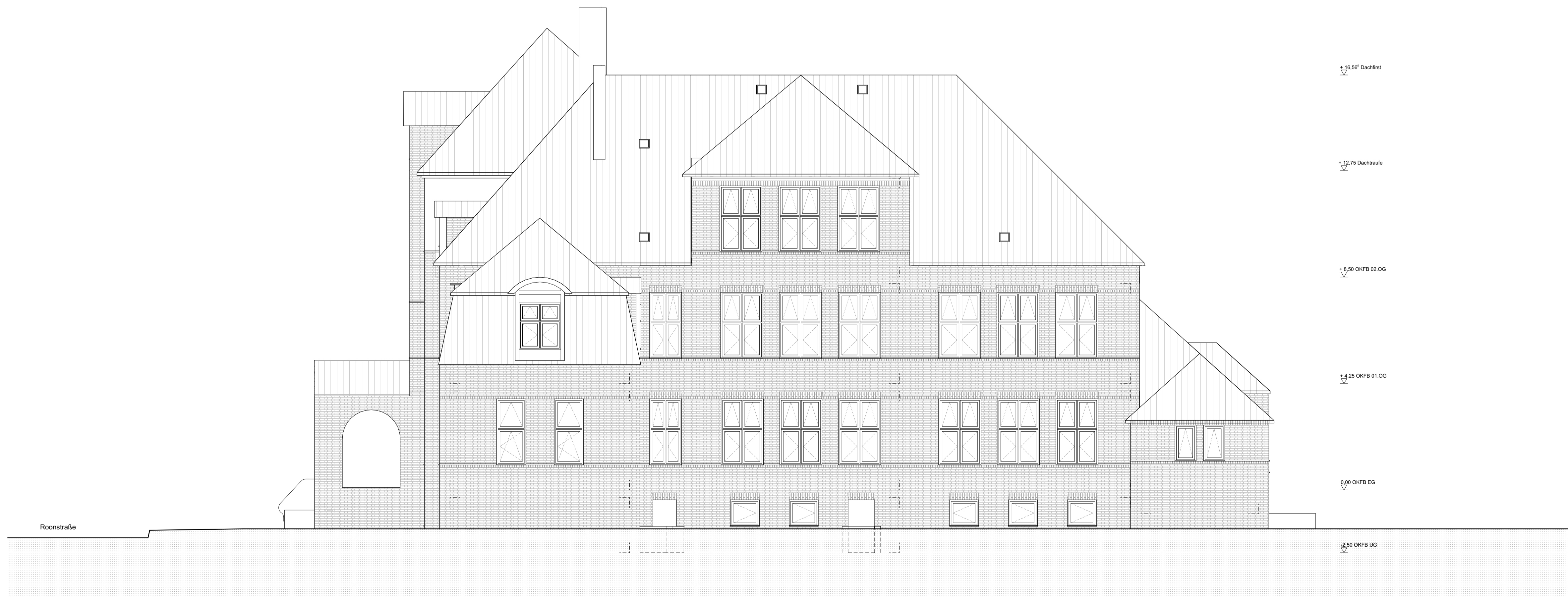
02 Ansicht Nord - Ost - Seitenstrasse M 1:100

Projekt Neumünster - Volkshochschule Helene-Lange-Schule Roonstr. 42 24534 Neumünster Status LP 03 - Entwurfsplanung Plan Nr. NM_320_01_0 Inhalt Ansicht Nord-West und Ansicht Nord-Ost Maßstab 1:100 Plangröße A1 quer - 100% 84.1x59.4cm / A3 quer - 50% Datum 21.08.24 Gezeichnet JA / MR / SH Datum Druck 28.10.24 Geprüft FS Bauherr Stadt Neumünster Brachenfelder Str. 1-3 24534 Neumünster Architekten Hütten und Paläste Kastanienallee 26 10435 Berlin