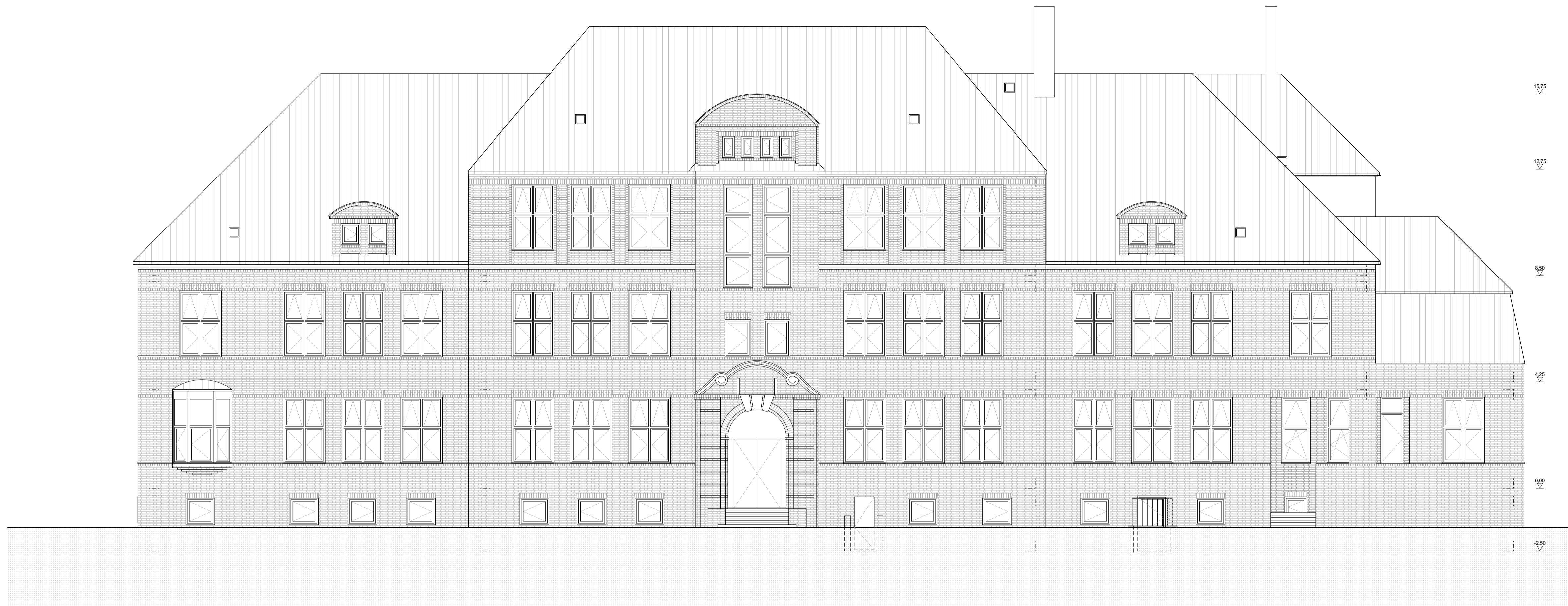
01 Ansicht Süd - Ost - Roonstraße - Haupteingang M 1:100

Der Entwurf ist geistiges Eigentum des Planers und urheberrechtlich geschützt. Vervielfältigungen und Weitergabe an Dritte erfolgt nur mit ausdrücklicher Genehmigung des Planverfassers. Alle Maße, Massen und Gegebenheiten am Bau und Umgebungsbestimmungen sind vom Unternehmer eigenverantwortlich zu prüfen. Bei Unstimmigkeiten ist unverzüglich die Bauüberwachung zu informieren. Dieser Plan ist nur gültig in Verbindung mit den aktuellen statischen Konstruktionsplänen und sämtlichen Detailplänen. Schlütze und Durchbrüche sind aus den Haustechnik- und Statikplänen zu entnehmen. Brüstungs-, Tür- und Fensterhöhen beziehen sich auf den Fertigfußboden. Alle Höhenangaben beziehen sich auf OK FB im jeweiligen Gebäudeteil.