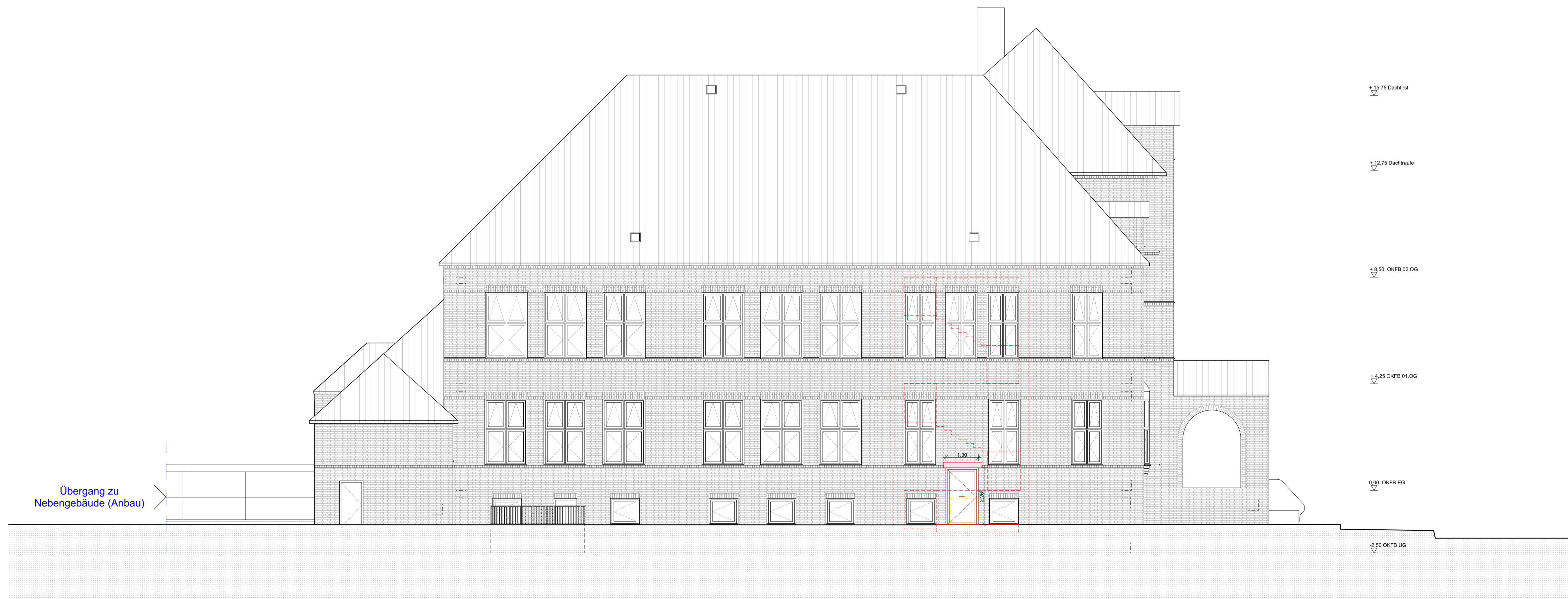
02 Ansicht Süd-West - Parkplatz M 1:100